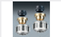
Omløbere - 3/4'' - kobber / stål

04 6539 416 - 16 mm alu pr. stk. kr. 60,-