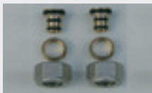
Omløbere - 3/4'' - pex / alupex

04 6539 315 - 15 mm pex pr. stk. kr. 60,-